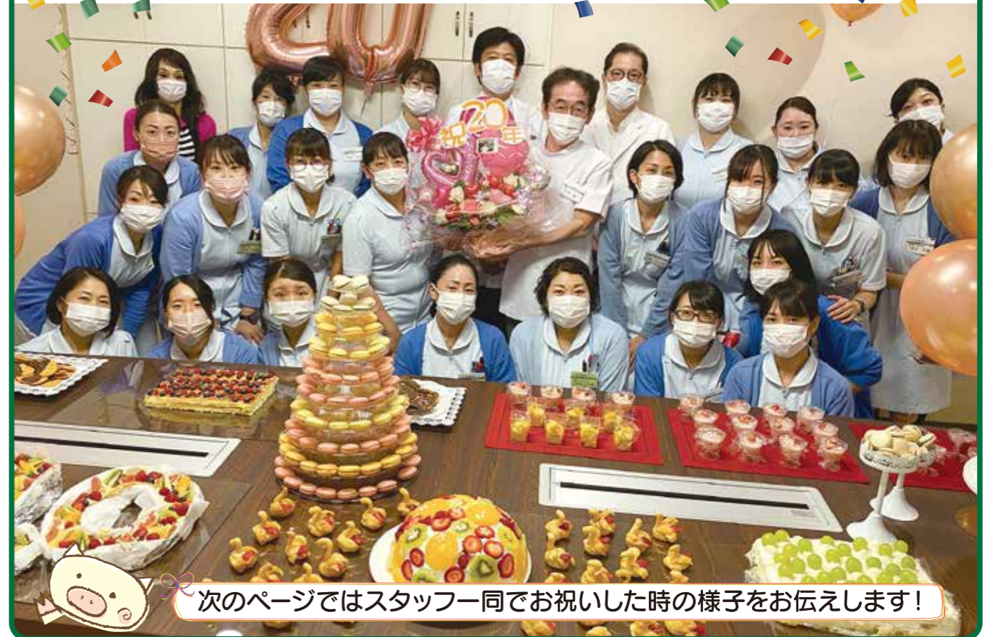
次のページではスタッフ一同でお祝いした時の様子をお伝えします!

当院は、令和3年10月20日をもちまして、開院20周年を迎えました。職員一丸となってこれからも「癒しの医療」を提供できるよう、より一層努力していきます。今後ともよろしくお願いいたします。