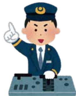
特定の職業両眼1.0以上

症状が進行し、視力が低下するなど、生活に不便さを感じたら手術が検討されます。不便さや必要な視力は生活様式や職業で決まるので、患者さんによって異なります。たとえば、視力1.0に達していなくても、日常生活を送ることは可能です。ご自身にはどのくらいの視力がよいか、確認しておきましょう。