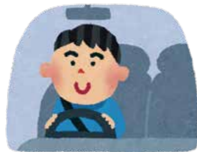
車の免許取得両眼0.7以上