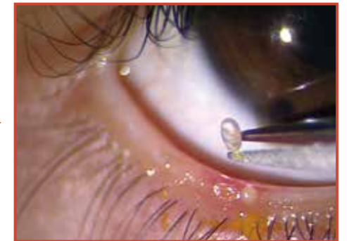
予 防 法 マイボーム腺が詰まっている部分除去前 除去後