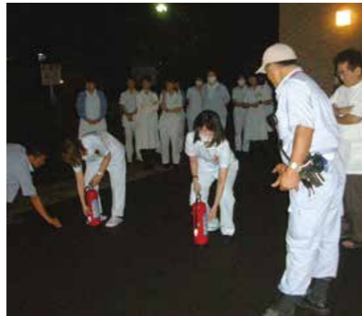
スタッフ全員で消火器の練習をします。いざという時に、こういう訓練が役に立ちます。

まずは全員で受付のある待合室に集合して、避難経路の確認と消火器の設置してある場所を確認します。 災害時に慌てないために、参加者全員が真剣に話を聞いています。