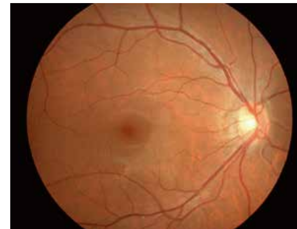
正常な方の眼底写真例

有名なプロボクサーが「網膜剥離で引退」とかは聞いたことはあるけど、身近な人が網膜剥離になったという話はあまり聞いたことがないという方も少なくないと思うので、今回は網膜剥離についてご紹介いたします。