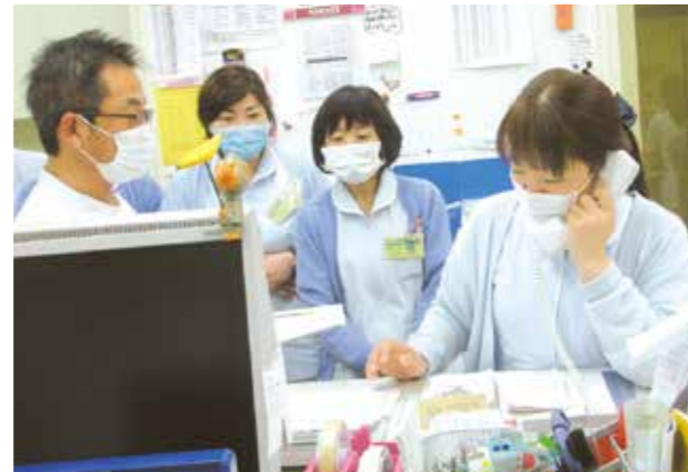
【消防への通報訓練】