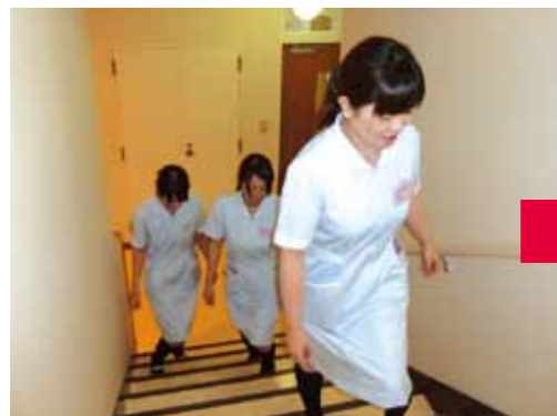
1 階段を使って、2階、3階へと上がります