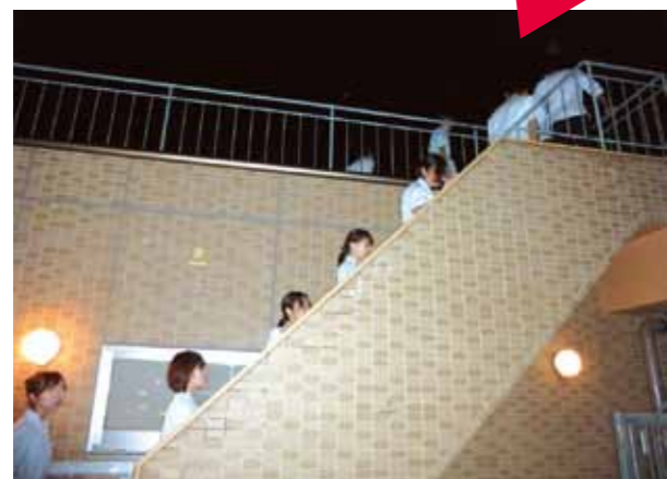
3 更に屋上へ避難します