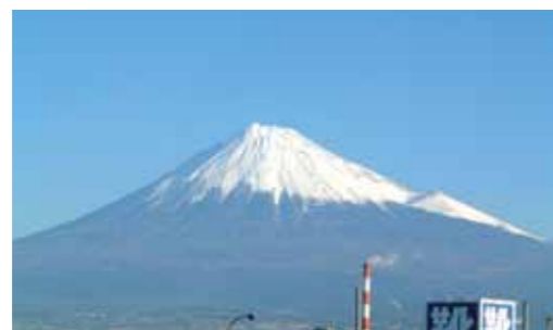
当院3階より見た富士山