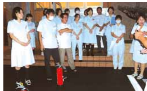
消火器の使い方を聞いています