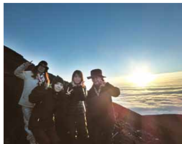
平成25年10月6日(日) 富士山7合目にて