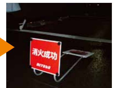
見事! 消化成功しました

東日本大震災での津波の被害は記憶に新しいところです。海の近くで生活している私たちにとっては人事ではありません。いざという時の為に正しい知識を身に付け、日頃から避難場所を確認するなど、備えが大事です。