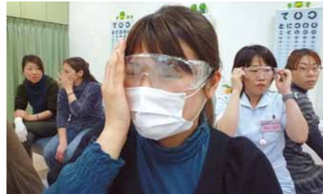
●緑内障ゴーグル... 初期視野進行のある患者様の視界の体験。