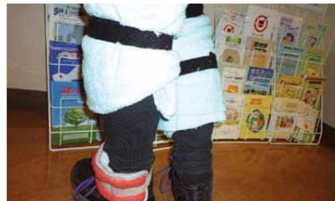
●タオル・重り... 関節可動域を制限しての、行動体験。