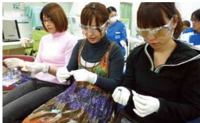
●手袋・ヘッドホン・点眼容器各種... 指先の感覚鈍磨などによる点眼体験。